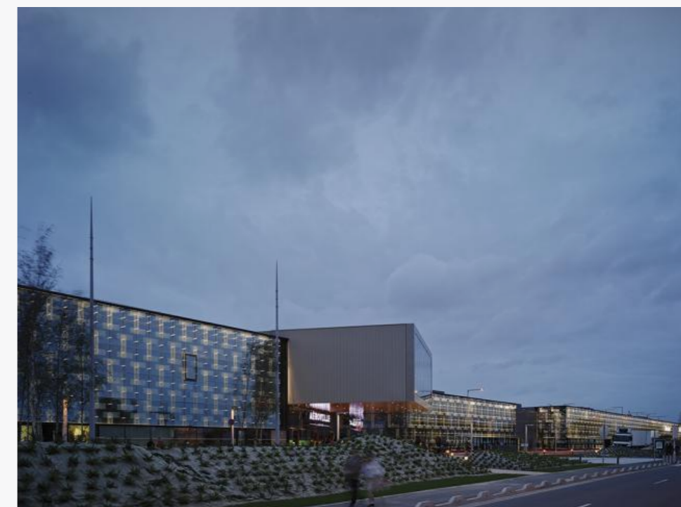
Комплекс Aéroville © Jean-Philippe Mesguen