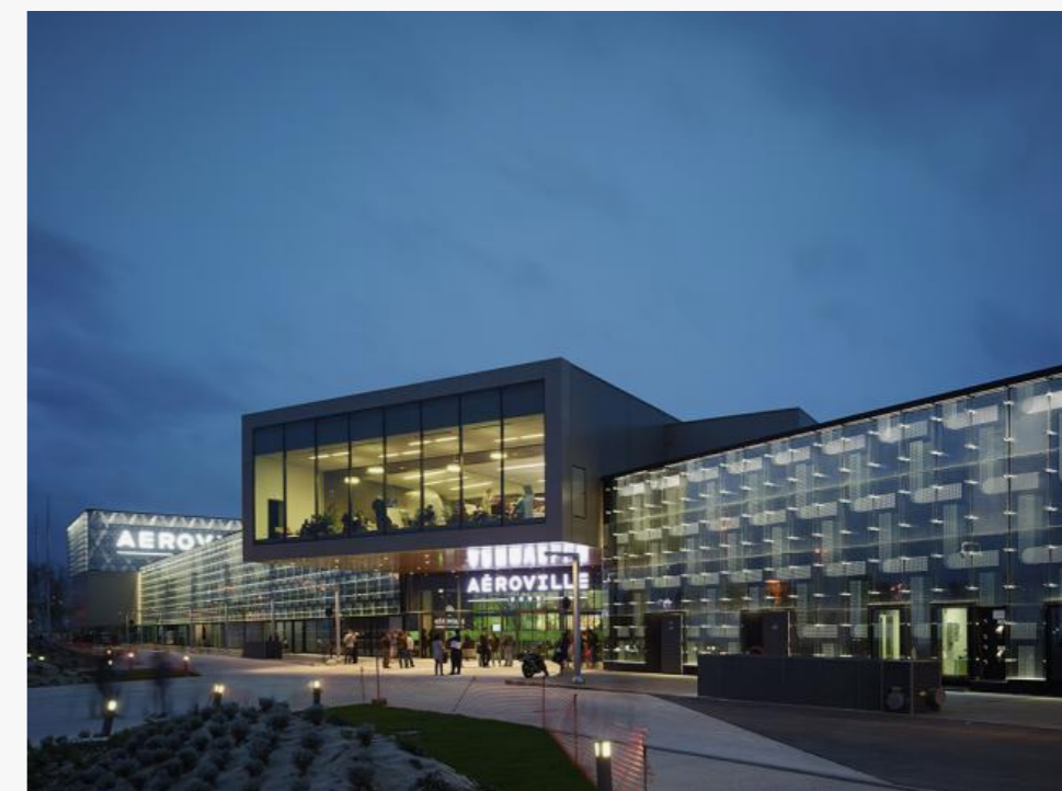
Комплекс Aéroville © Jean-Philippe Mesguen

Среди якорных арендаторов комплекса – гипермаркет сети «Ашан» и 12-зальный кинотеатр сети EuropaCorp, одним из учредителей которой является режиссер Люк Бессон. В подземной части комплекса размещена парковка, а имевшийся на участке перепад высот позволил архитектуре приподнять северный вход в нее до уровня земли и за счет этого обеспечить пространство для хранения автомобилей дневным светом и вентиляцией.