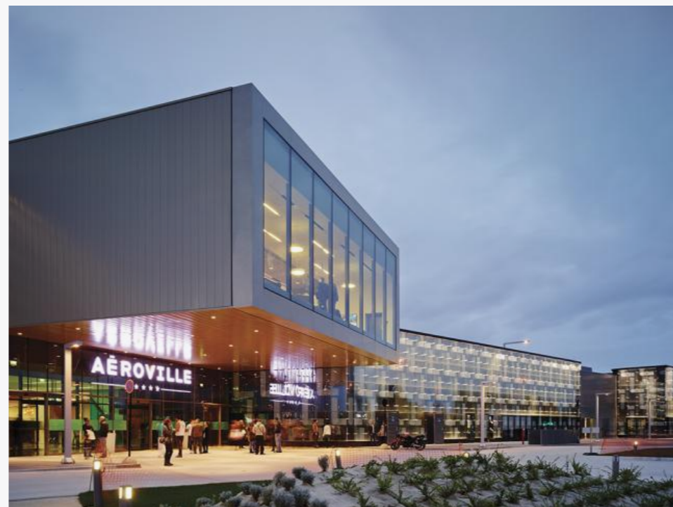
Комплекс Aéroville

Парижский аэропорт имени Шарля де Голля – один из самых крупных и динамично развивающихся авиаузлов континентальной Европы. О его масштабах свидетельствует хотя бы тот факт, что сегодня на территории аэропорта находится 10 бизнес-парков и несколько крупных логистических комплексов, а также развитая сеть отелей. Пожалуй, единственное, чего не хватало многочисленным работникам аэропорта и его пассажирам (а это более 150 тысяч человек в день) – торгово-развлекательный комплекс, где можно перекусить, сделать покупки и посмотреть кино после смены или в ожидании стыковочного рейса. Также этот комплекс рассчитан на жителей прилегающих территорий, которые будут развиваться в рамках программы «Большой Париж». Aéroville, суммарная площадь торговых помещений которого превышает 84 тыс. м 2 , этот пробел призван восполнить, сделав главный аэропорт Парижа наиболее «разноплановым» транспортным хабом Европы.