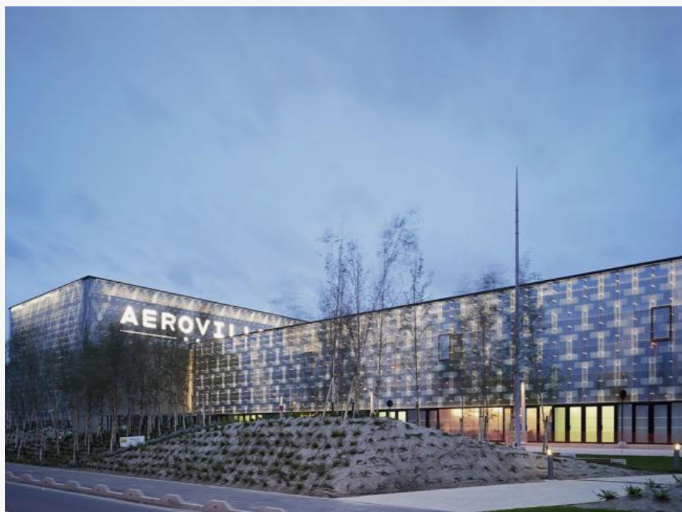
Комплекс Aéroville © Jean-Philippe Mesguen