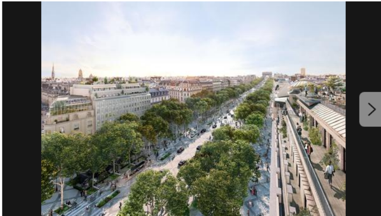
1/14 - Le haut des Champs-Élysées où devraient fleurir une cinquantaine de rooftop. PCA-Stream

Par Claire Bommelaer et Erwana Le Guen Publié il y a 2 heures, mis à jour il y a 21 min