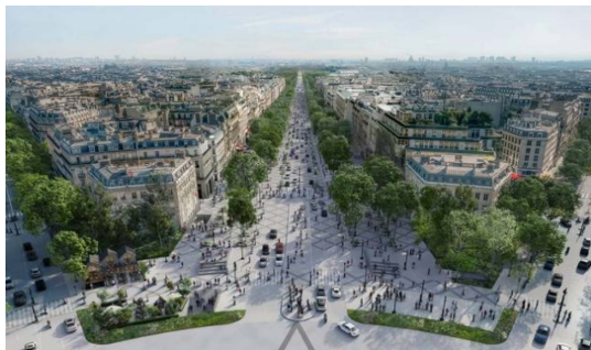
L'avenue des Champs-Élysées vue depuis la place de l'Étoile, telle qu'imaginée par le projet —

Comment rendre les Champs-Élysées aux Parisiens ? C'est à cette question que tente de répondre le projet « Vision 2030 » proposé par l'architecte Philippe Chiambarella et son agence PCA-Stream, et présenté au public à l'occasion d'une exposition qui s'ouvre ce vendredi au Pavillon de l'Arsenal à Paris. Cette étude portée par le Comité Champs-Élysées qui rassemble les acteurs économiques et culturels du quartier part du constat de désaffection des Parisiens à l'égard de « la plus belle avenue du monde »