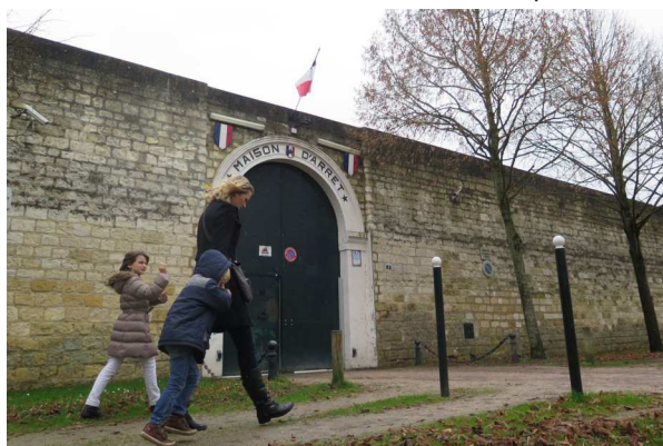
La vente aux enchères de l'ancienne maison d'arrêt de Compiègne aura lieu du 21 au 23 septembre sur Internet.